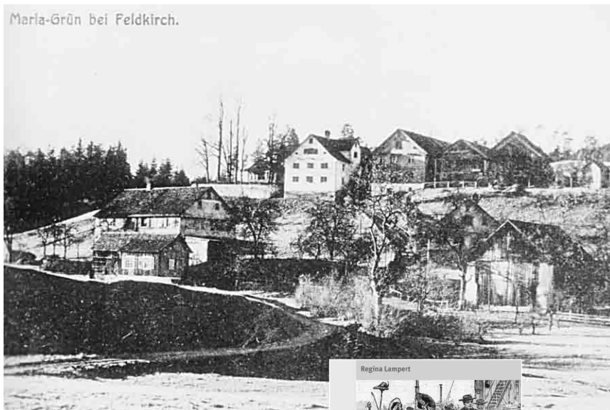
Maria-Grün bei Feldkirch.