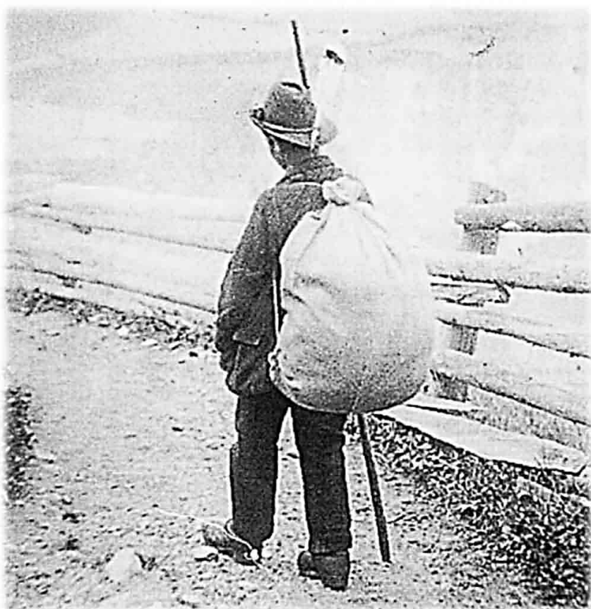
Ein Schwabekind auf der Heimreise