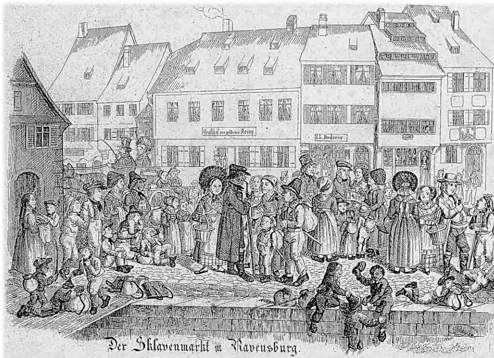
„Der Sklavenmarkt in Ravensburg“ (Lithographie von Joseph Bayer aus dem Jahr 1849)

Viele Unverheiratete mussten als Mägde, Tagelöhnerinnen, Heimarbeiterinnen oder in der Fabrik arbeiten und Männer saisonale Wanderungsarbeit (meist auf den Bau nach Frankreich) aufnehmen, sodass die Landwirtschaft von den daheim gebliebenen Frauen besorgt wurde, weshalb die Schwabenkinder genauso gut auch hier bleiben hätten können.