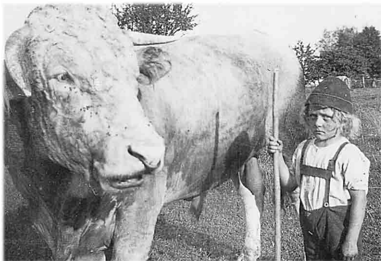
Kinder von neun bis fünfzehn Jahren, mitunter aber auch schon Siebenjährige mussten sich im Schwabenland verdingen (Foto: Stadtarchiv Ravensburg).

ge übernachtet. Am nächsten Tag erreichte man zu Fuß Bregenz, wo die Kinder eine Suppe, Wurst und Brot bekamen. In Bregenz konnte gar ein Dampfschiff nach Friedrichshafen bestiegen werden, wo die ersten Kinder bereits abgeholt wurden. Mit der Eisenbahn erreichte man schließlich Ravensburg. Auf dem Marktplatz stand eine große Halle mit Aufschrift „Markthalle für Hirtenkinder und Dienstboten“. Die größeren Kinder konnten schon selbst mit den Bauern verhandeln, je nach der Größe und Stärke bekamen sie Lohn für den ganzen Sommer.